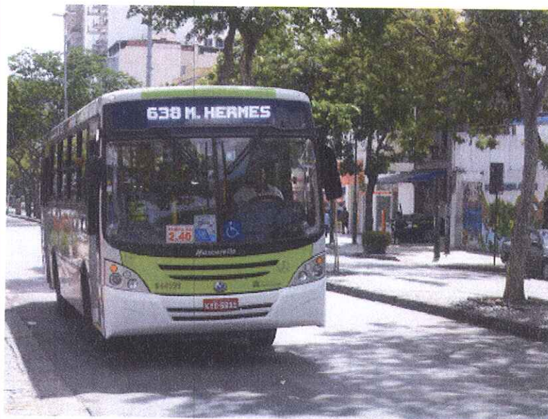
Ônibus do Sistema Internorte que compõem as linhas da Zona Norte