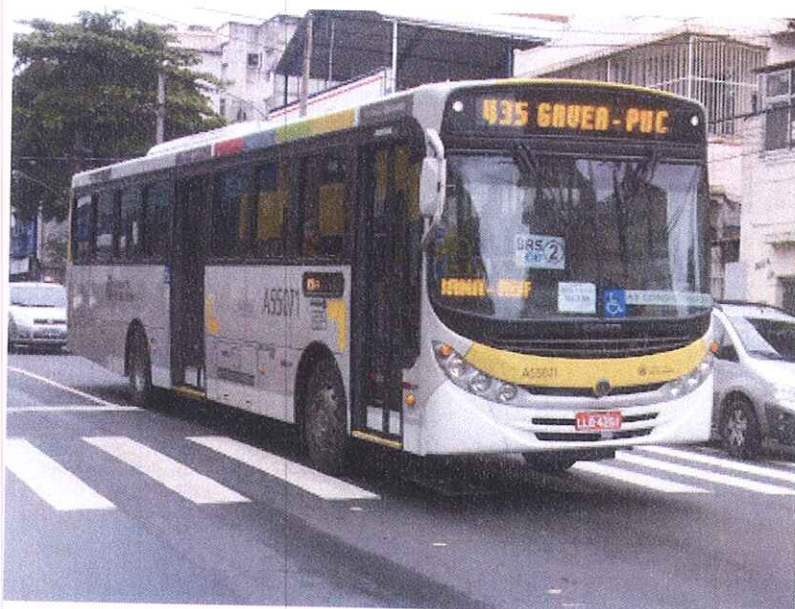
Ônibus do Sistema Intersul que compõem as linhas da Zona Sul