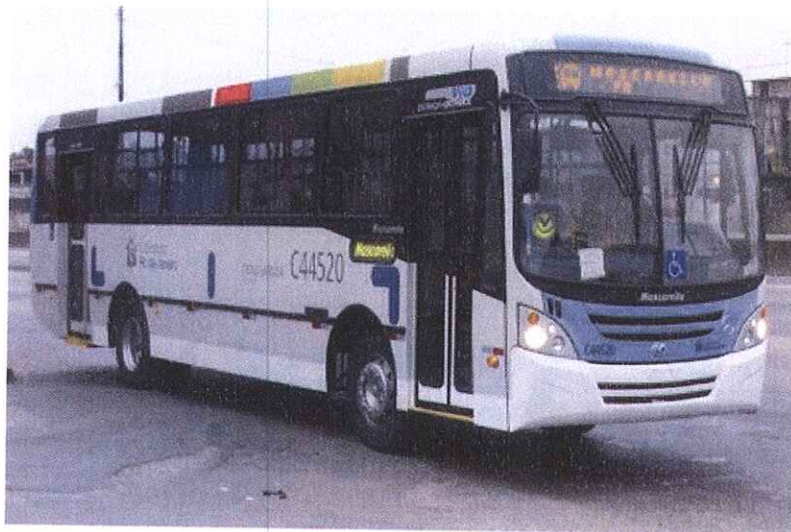
Ônibus do Sistema Transcarioca que compõem as linhas da Zona Oeste