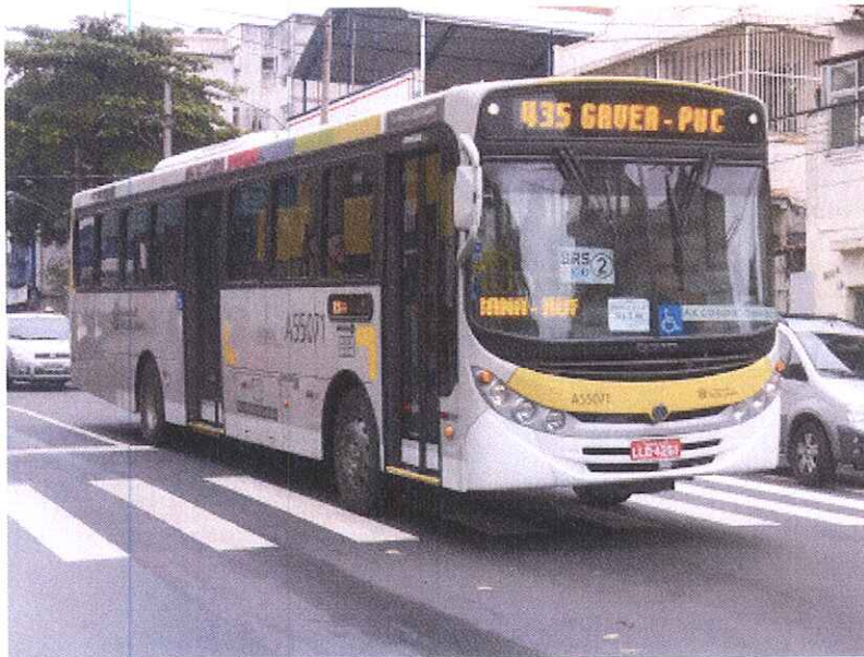
Ônibus do Sistema Intersul que compõem as linhas da Zona Sul