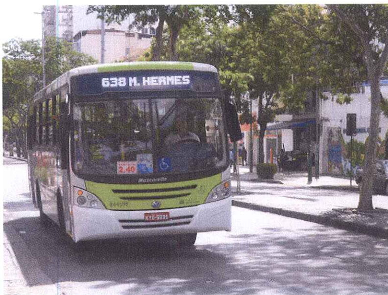
Ônibus do Sistema Internorte que compõem as linhas da Zona Norte