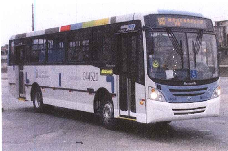
Ônibus do Sistema Transcarioca que compõem as linhas da Zona Oeste