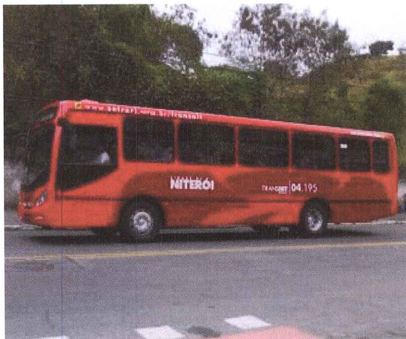
Ônibus que circula em Niterói