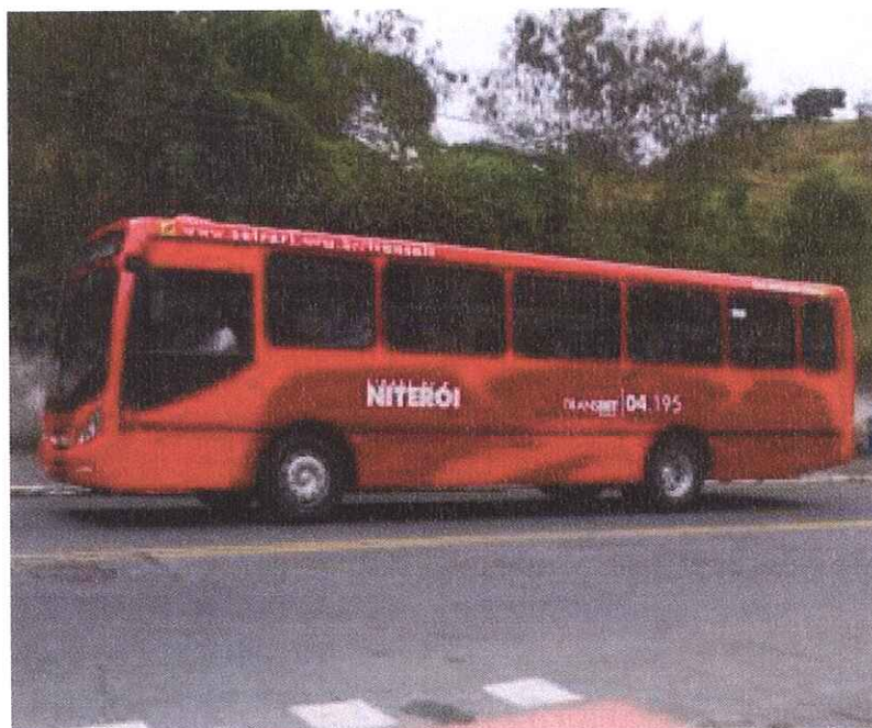
Ônibus que circula em Niterói