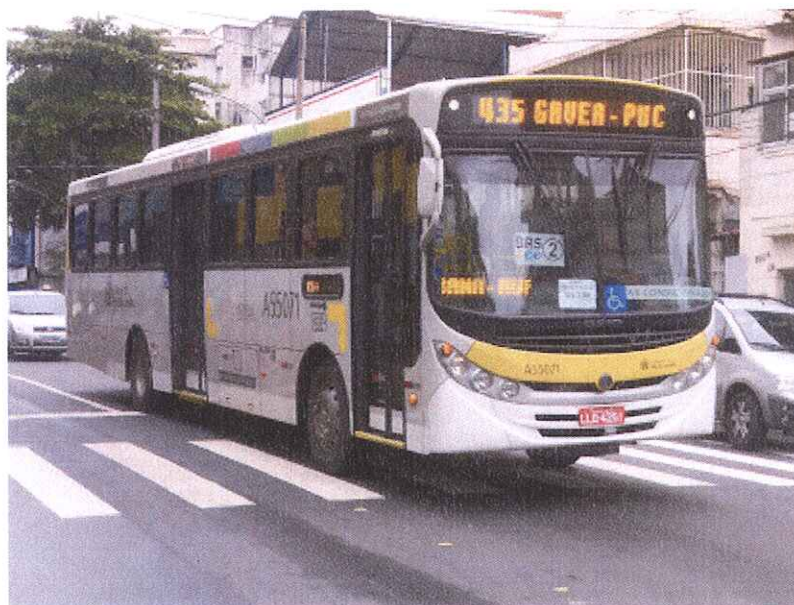
Ônibus do Sistema Intersul que compõem as linhas da Zona Sul