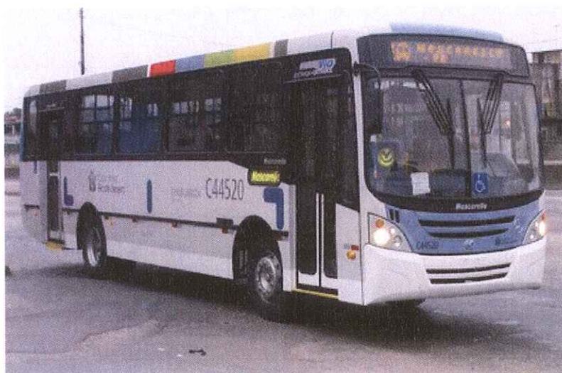
Ônibus do Sistema Transcarioca que compõem as linhas da Zona Oeste