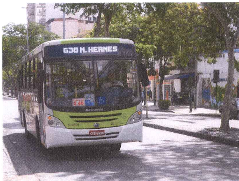
Ônibus do Sistema Internorte que compõem as linhas da Zona Norte