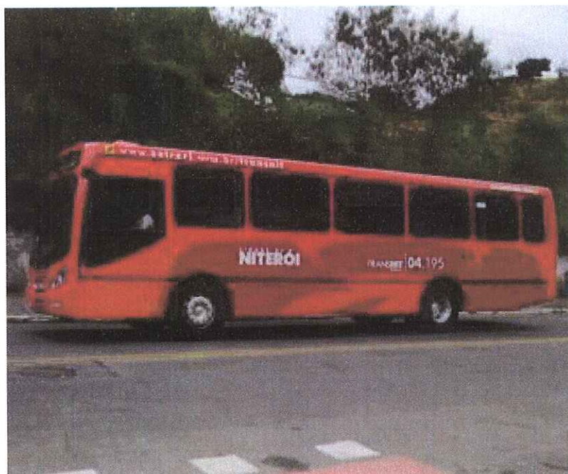
Ônibus que circula em Niterói