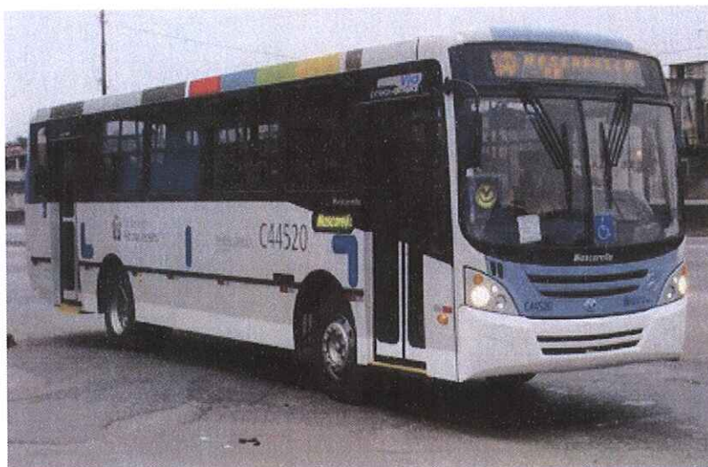
Ônibus do Sistema Transcarioca que compõem as linhas da Zona Oeste