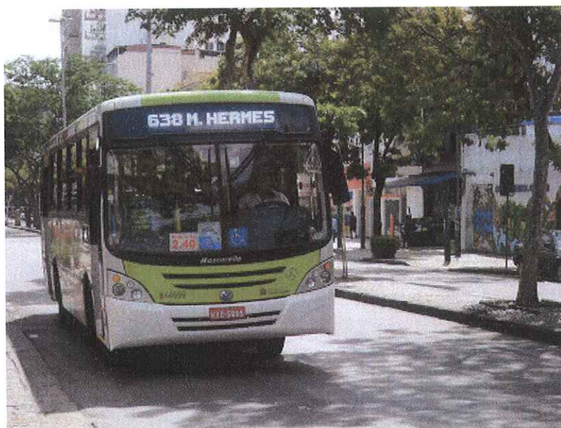
Ônibus do Sistema Internorte que compõem as linhas da Zona Norte