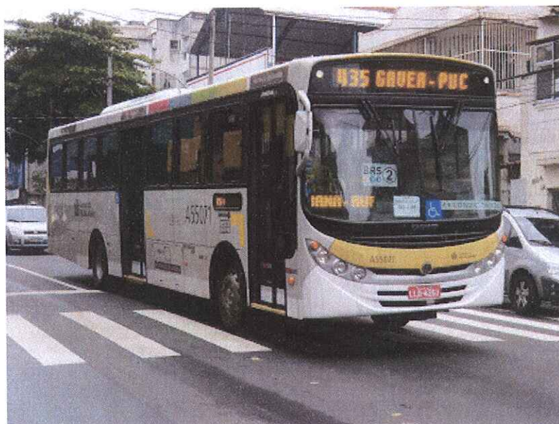
Ônibus do Sistema Intersul que compõem as linhas da Zona Sul