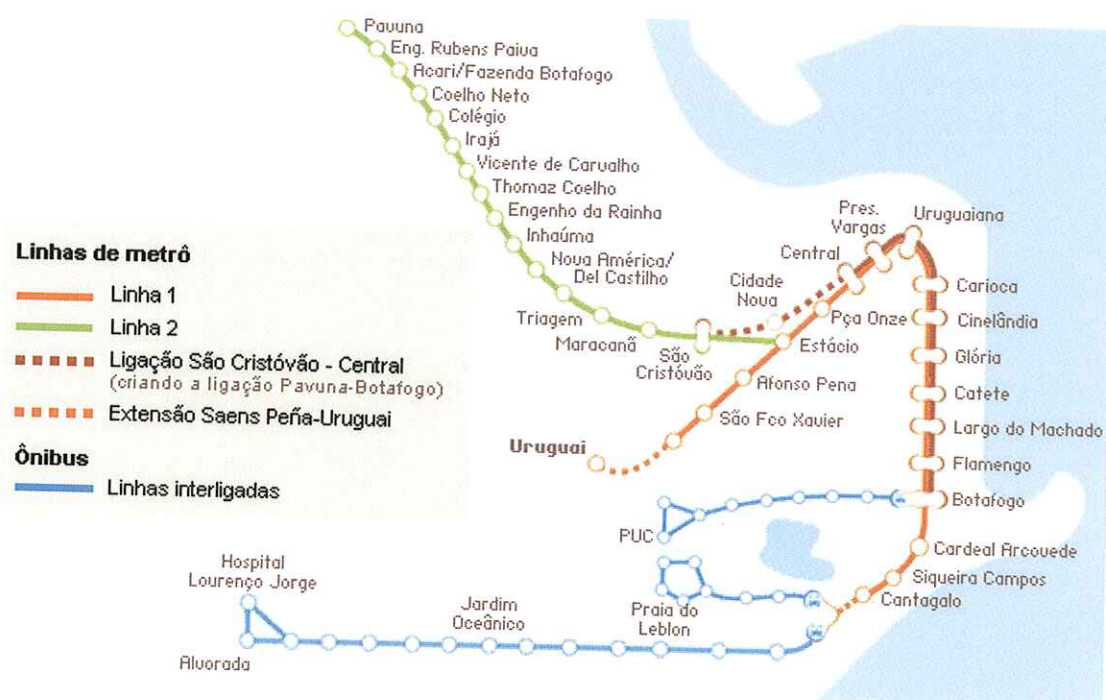
Mapa das estações do Metrô

Metrô: Quem sai da Zona Sul deve pegar o trem linha 1 (General Osório – Saens Peña). O usuário deve saltar em alguma estação antes da Central do Brasil e aguardar na mesma plataforma o trem da linha 2 (Botafogo – Pavuna) e descer na estação Maracanã. Aos finais de semana e feriados, ao pegar o trem da linha 1, o usuário deve saltar na estação Estácio, e fazer transferência para a Linha 2. Ao sair da rampa da estação, seguir à direita.