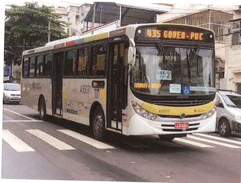
Ônibus do Sistema Intersul que compõem as linhas da Zona Sul