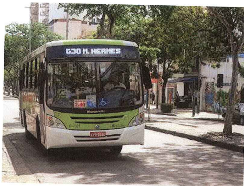
Ônibus do Sistema Internorte que compõem as linhas da Zona Norte