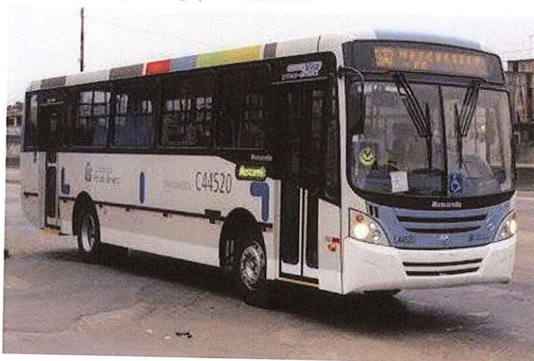
Ônibus do Sistema Transcarioca que compõem as linhas da Zona Oeste