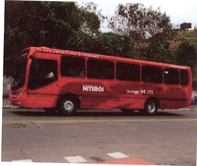
Ônibus que circula em Niterói