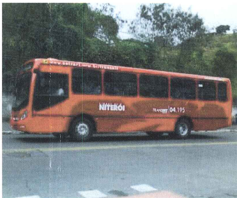
Ônibus que circula em Niterói