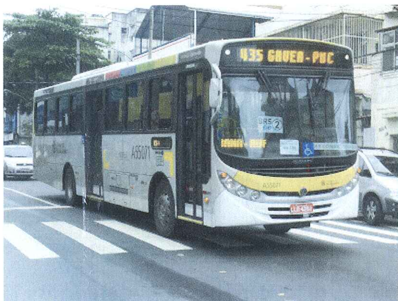
Ônibus do Sistema Intersul que compõem as linhas da Zona Sul