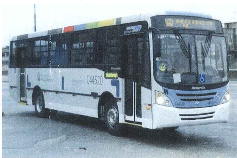
Ônibus do Sistema Transcarioca que compõem as linhas da Zona Oeste