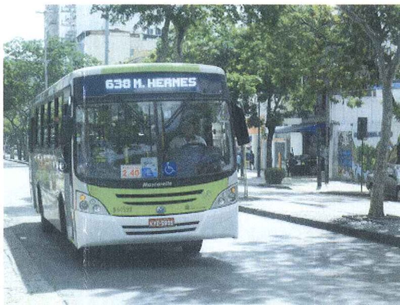
Ônibus do Sistema Internorte que compõem as linhas da Zona Norte