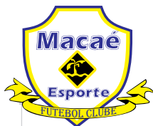
Macaé Esporte (RJ)