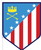
São João da Barra (RJ)